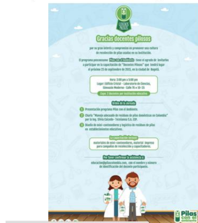
Capacitación Pilas con las pilas

Dentro de este proceso el colegio realiza campañas para la instalación de interruptores para algunos salones que se pueden mantener con luz día, como también de la campaña por el ambiente de la recolección de pilas para su disposición final.