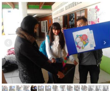
Programa Basura Cero

3. Programa de Gestión Integral de Residuos: Este programa deberá garantizar que los residuos generados, ya sean aprovechables, no aprovechables, peligrosos, especiales, vertimientos o emisiones atmosféricas tengan un manejo integral conforme a la normativa vigente en la materia, incluyendo un componente de prevención, minimización y aprovechamiento con el fin de evitar la generación de residuos en cuanto sea posible. Igual que ya hace tres años, el colegio sigue vinculado con la campaña de sanar cáncer, organización sin ánimo de lucro que cada periodo nos recoge las tapitas que amablemente la comunidad dona, al igual que se continua con la campaña "rueda la bola" con la que se busca minimizar la cantidad de residuos plásticos de los refrigerios.