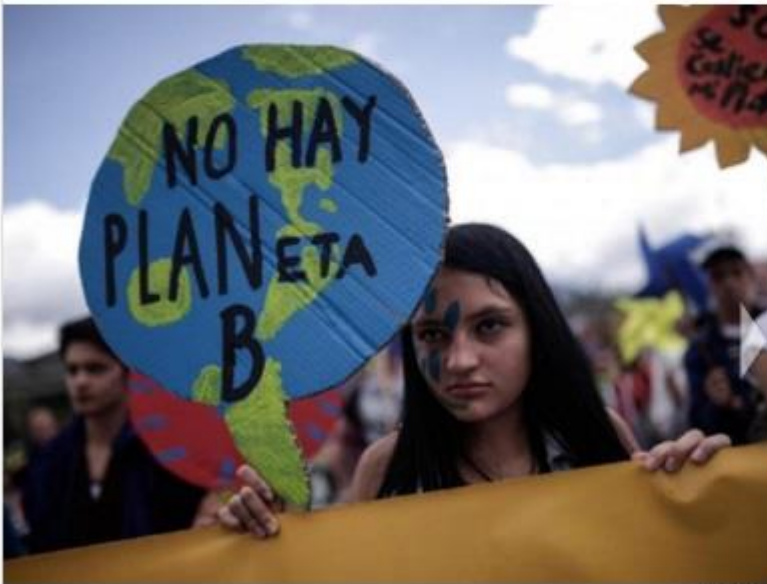
Una mujer sostiene un cartel durante la Marcha Mundial por el Clima, en Bogotá, Colombia.

Las marchas buscan presionar y hacer escuchar las voces de los ciudadanos