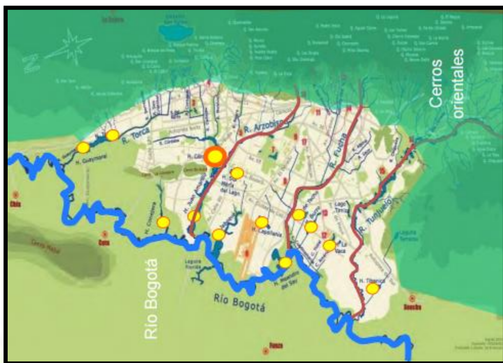
SISTEMA HÍDRICO DE BOGOTÁ

Es entonces el resultado de la aplicación de esos mecanismos y procesos, con una mirada del agua como bien común. Y desde la escuela, como ejercicio pedagógico, la gobernabilidad del agua se realiza desde las acciones cotidianas de los niños, niñas, jóvenes donde desarrollan la capacidad de “administrar” este líquido vital, voluntaria y reflexivamente, a partir del reconocimiento del agua como parte de su cuerpo y del desarrollo de su vida, y la vida de otros seres vivos.